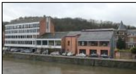
Centre IFAPME de Namur